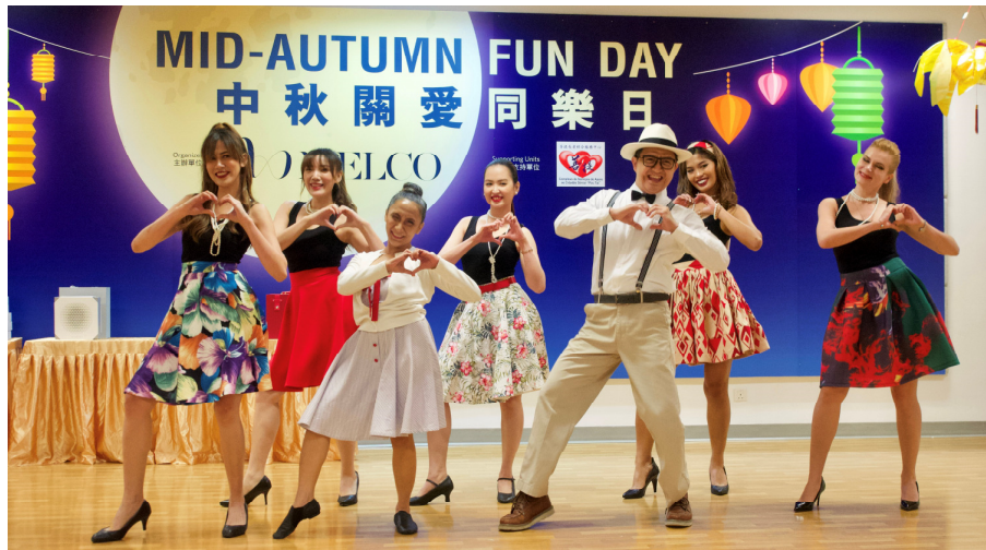
延續一貫新濠於中秋節的傳統，主席兼行政總裁何猷龍先生與 50 多名義工透過音樂、舞蹈和魔術表演，與長者共度中秋並派發月餅